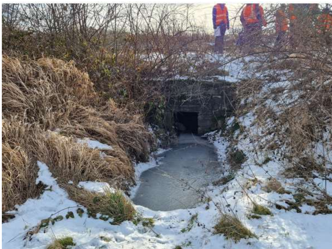
Pohled na výtok