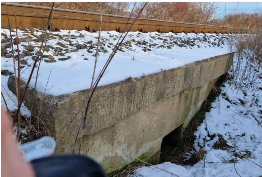
Pohled na vtok